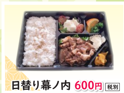
日替り幕ノ内 600円 税別