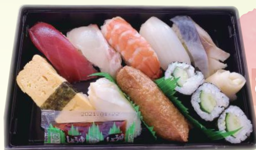
寿司 800円 税別