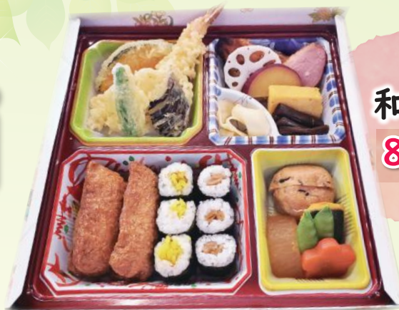
和風弁当 800円 税別