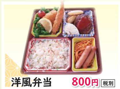
洋風弁当 800円 税別