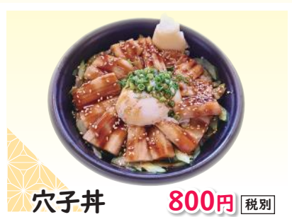
穴子丼 800円 税別