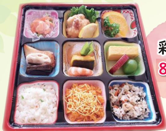
彩り弁当 800円 税別