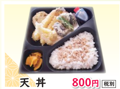
天井 800円 税別