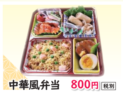
中華風弁当 800円 税別