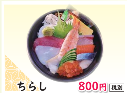
ちらし 800円 税別